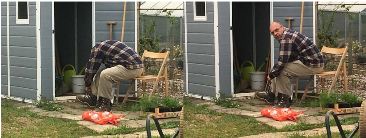
Wie ben ik???

Het tuinseizoen is weer gestart en we kunnen gerust zijn. De slakken zijn er nog. Wat zouden we ook zonder slakken moeten. Afgelopen seizoen zijn we er zo aan gehecht geraakt. Wat wel is: het zijn er minder, althans tot nu toe. Het voorjaar is ook beter: wat warmer en wat droger. Ik zou kunnen stellen dat het voor ons als tuinders misschien wat te droog is. Misschien ben ik dan te veeleisend. Maar we kunnen in elk geval goed spitten en al wat planten. Voor de nieuwkomers dit jaar. Niet overhaast planten want de ijsheiligen zijn 13, 14 en 15 mei en tot dan kan het altijd nog even vriezen.